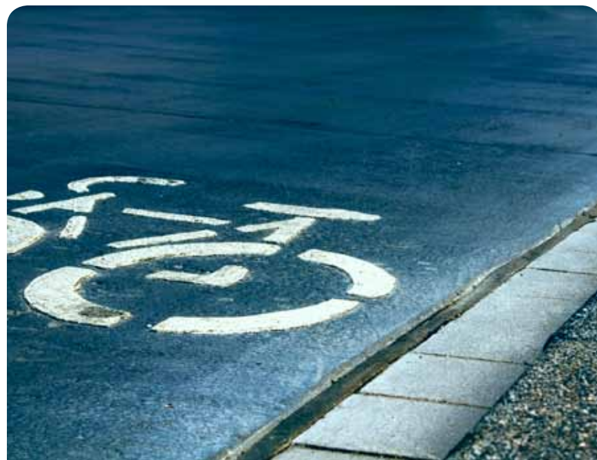
Schwieriges Pflaster für FahrradfahrerInnen