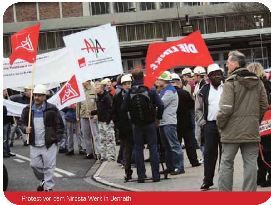
Protest vor dem Nirosta Werk in Benrath

Dass sie dabei massiv gegen die Geschäftsordnung des Rates verstieß, war ihr egal. Die Ratsfraktion DIE LINKE wird dies nicht hinnehmen und das Verhalten von Strack-Zimmermann gerichtlich überprüfen lassen. In Sonntagsreden von Solidarität mit den BürgerInnen schwätzen, aber wenn es drauf ankommt die Probleme der Menschen aus dem Rat heraushalten, lässt DIE LINKE nicht durchgehen.