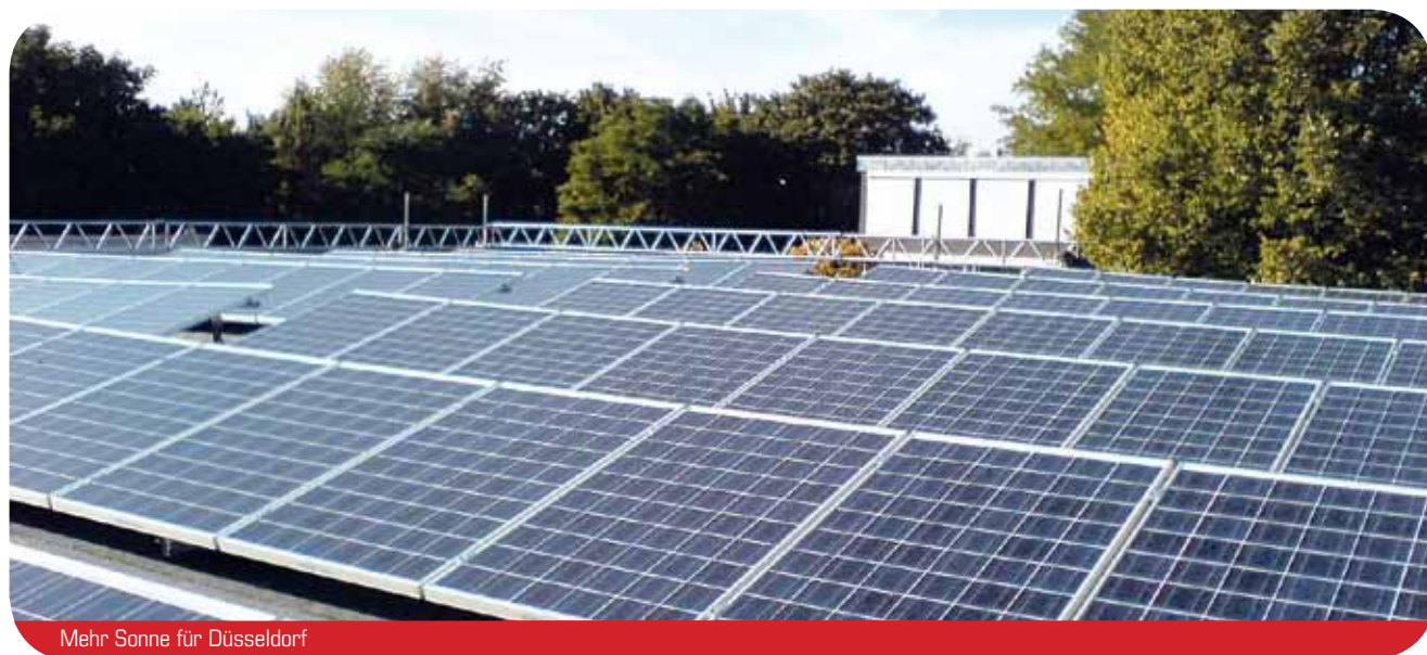
Mehr Sonne für Düsseldorf

Das Interesse der BürgerInnen übersteigt bei weitem das Angebot der Stadt an geeigneten Dächern. Die Ratsfraktion DIE LINKE fordert die Stadtverwaltung auf, auf breiter Ebene die BürgerInnen in ihrem Engagement zu unterstützen und alle geeigneten städtischen Dächer für Bürgersolaranlagen zur Verfügung zu stellen.