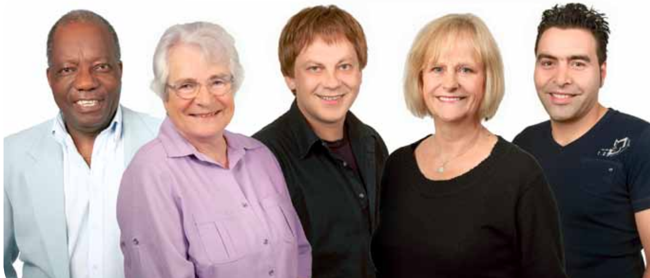
Die Ratsfraktion DIE LINKE. im Rat der Landeshauptstadt Düsseldorf

Die Ratsfraktion DIE LINKE. stellt sich vor