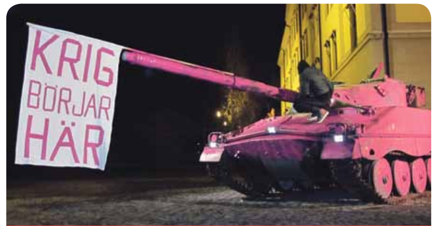
Rosa Panzer als Protestform

Durch die Profite von Rheinmetall fließen nicht unerhebliche Gewerbesteuern in die Kassen der Stadt Düsseldorf. Die angebliche „Schuldenfreiheit“ der Stadt Düsseldorf wird also auch durch den Tod von Menschen in Kriegs- und Krisengebieten durch Rheinmetall-Waffen finanziert.