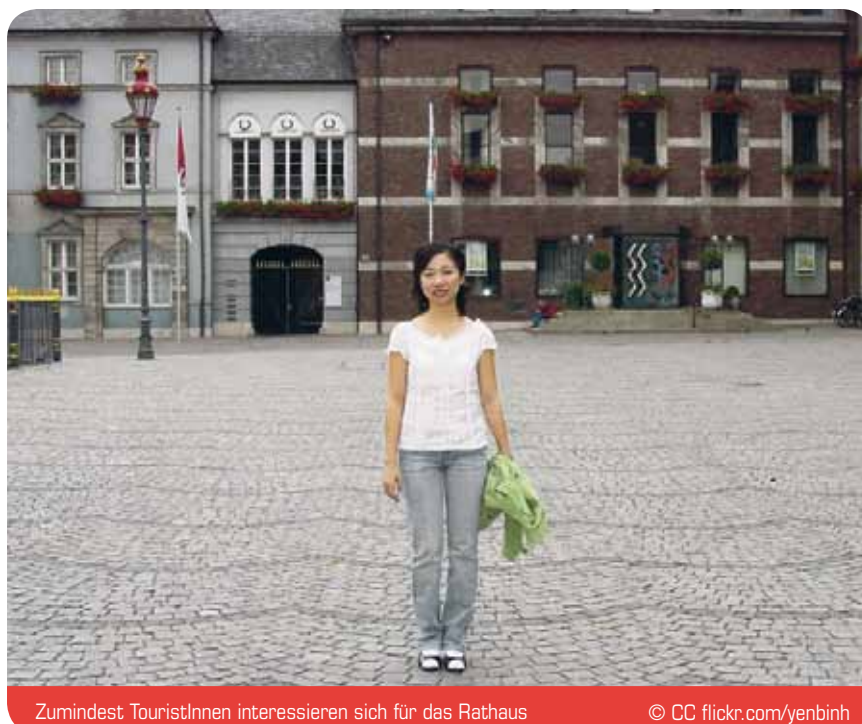
Zumindest TouristInnen interessieren sich für das Rathaus

Nun werden die Parteien diesen Haushaltsentwurf studieren. Die Ratsfraktion DIE LINKE sowie die Mitglieder der verschiedenen Ausschüsse werden dies unter anderem auf ihrer Klausur Mitte Oktober tun. Für die Ratssitzung im Dezember und den Etat-Sitzungen der Ausschüsse werden Anträge erarbeitet, wo es dringend geboten ist, mehr beziehungsweise zusätzliches Geld auszugeben. Gleichzeitig werden Vorschläge erarbeitet wo Geld eingespart werden muss und kann.