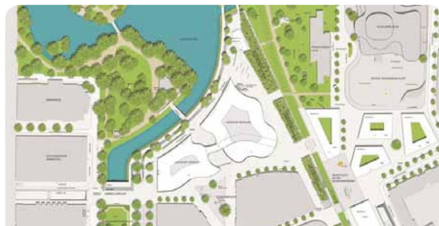
Alles schön bunt im Hochglanz Prospekt

Der „Kö-Bogen“ allerdings soll unverändert durchgezogen werden. Die Entscheidung, ob der unter Denkmalschutz stehende Tausendfüßler abgerissen werden soll, liegt jetzt bei der Landesregierung. Es ist zu hoffen, dass sie diesen Größenwahn stoppt.