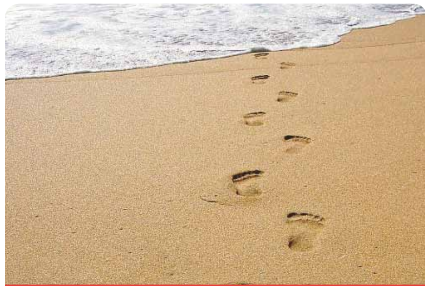
Unter dem Pflaster liegt der Strand

Wir fordern den Oberbürgermeister auf, sich umgehend mit seinem Amtskollegen in dieser Stadt, südlich von Düsseldorf gelegen, in Verbindung zu setzen um weitere Vorfälle zu unterbinden.