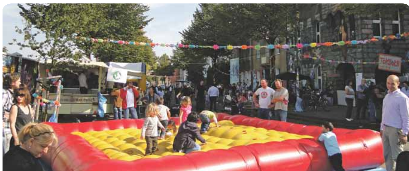
Viel Spass auf dem Kiefernstrassenfest

träge. Jetzt begann der Kampf um die Sanierung, der bis heute anhält. Es ist durchgesickert, die Stadt wolle in 2012 drei Millionen bei der Sanierung einsparen. Das wird die LINKE-Ratsfraktion nicht hinnehmen. Die angebliche Schuldenfreiheit darf nicht auf Kosten der BewohnerInnen der Kiefernstraße zustande kommen. Die Kiefernstraße ist auch ein Lehrstück für BürgerInnen-Widerstand. Ohne die mutigen Men-