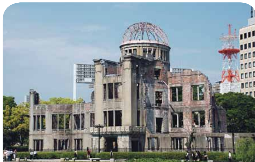
Atomwaffenmahnmal in Hiroshima

Reihe von Ausstellungen, die in Stadtteilen erarbeitet wurden, die Verlegung von Stolpersteinen und einiges mehr. Der Beitritt zu den Mayors for Peace wäre ein weiterer Schritt, um der japanischen Bevölkerung – als Ursprung dieser Initiative – wie auch unserer Sehnsucht nach einer friedlichen und atomwaffenfreien Welt deutlichen Ausdruck zu verleihen.