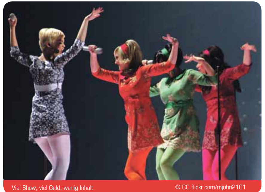
Viel Show, viel Geld, wenig Inhalt

Wer erinnert sich in der weiten Welt noch an Düsseldorf? Wer weiß noch, wo zum Beispiel 2007 der ESC stattgefunden hat? Es ist eine naive Träumerei, das ein paar Tage Spektakel in einer Stadt voller Baustellen den Tourismus ankurbeln könnte. Für zehn Millionen Euro hätte beispielsweise viele Jahre für die DüsseldorferInnen ein Sozialticket finanziert werden können.