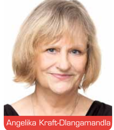
Bezirksvertretung 10 Garath, Hellerhof