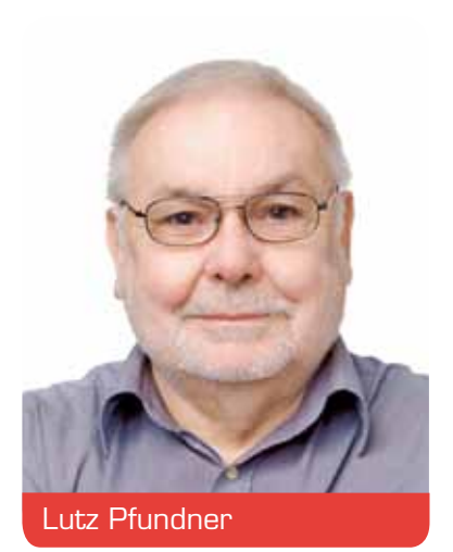
Bezirksvertretung 8 Eller, Lierenfeld, Vennhausen, Unterbach