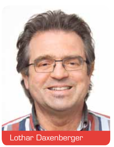
Bezirksvertretung 6 Lichtenbroich, Unterrath, Rath, Mörsenbroich