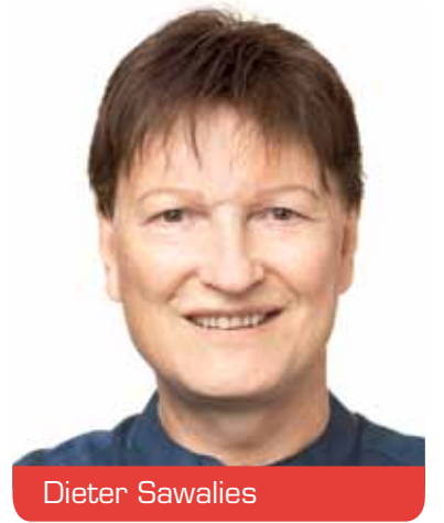
Bezirksvertretung 3 Oberbilk, Unterbilk, Bilk, Friedrichstadt, Hafen, Hamm, Flehe, Volmerswerth