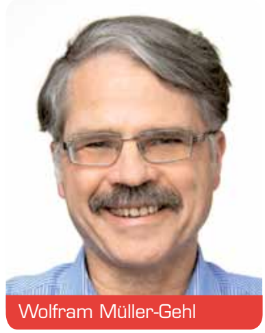
Bezirksvertretung 7 Gerresheim, Grafenberg, Ludenberg, Hubbelrath, Knittkuhl