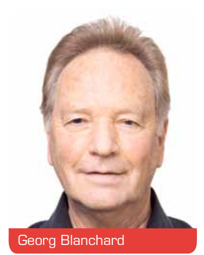
Bezirksvertretung 4 Oberkassel, Heerdt, Lörick, Niederkassel