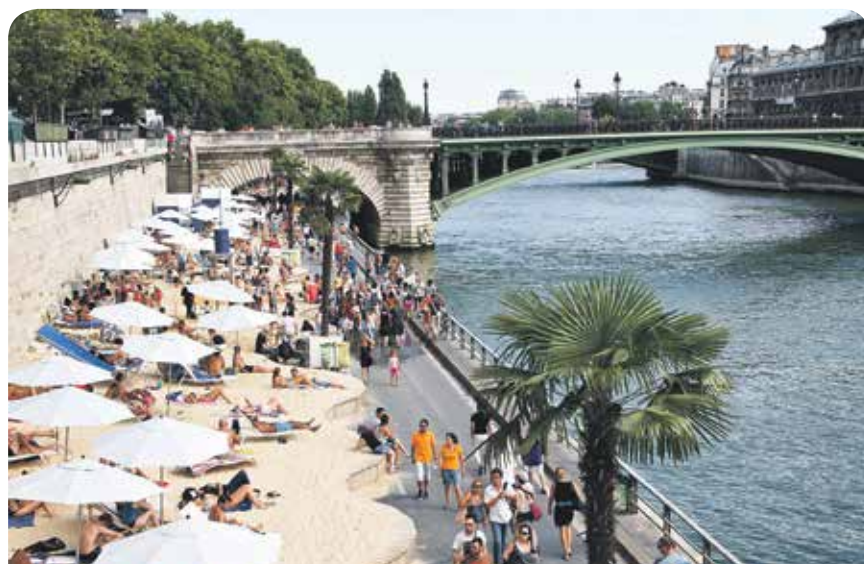
Paris macht es vor: Strand statt Autos

einem Gutachten des Ingenieurbüros Lohmeyer um 60 Prozent abnehmen. Das ist nur erreichbar, wenn die Stadt auch PendlerInnen davon überzeugt, auf besonders belasteten Strecken auf den ÖPNV umzusteigen. Deshalb muss die Stadt allen VerkehrsteilnehmerInnen so schnell wie möglich Angebote machen, die kostengünstig, komfortabel und vor allem schneller als der Individualverkehr sind. Gerade an Verkehrsbrennpunkten müssen mehr Bahnen und Busse dicht getaktet auf eigenen Spuren fahren. Die Rheinbahn muss ihre Kapazitäten deutlich ausbauen, um mehr Pendler zu befördern. Kostenlos nutzbare Parkplätze