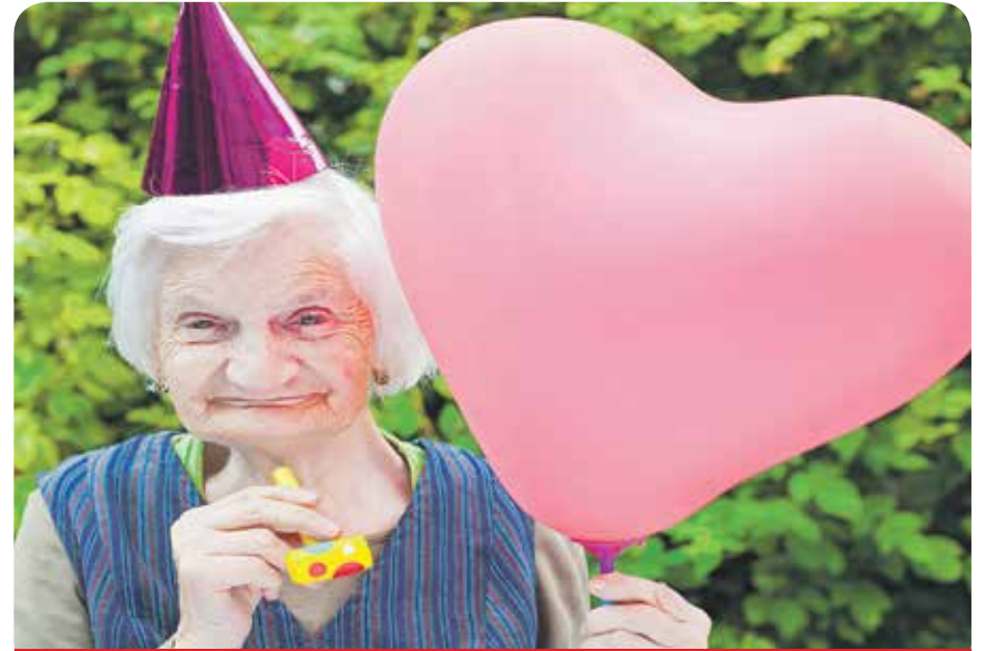
Genug mit billigem Kram zum Frauentag

Übrig geblieben ist noch die Verleihung am 8. März. Aus dem Frauenpreis wurde ein Gleichstellungspreis, aus dem Engagement für die Gleichberechtigung der Frauen wurde ein Engagement für