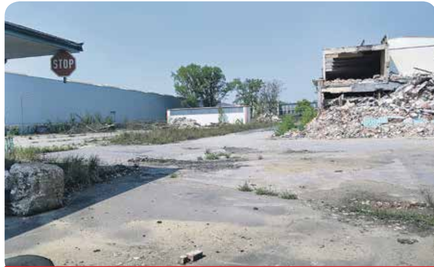
Die ersten Bäume wurden schon gefällt - ohne Genehmigung

Nach der Gemeindeordnung muss dann der Rat entscheiden. Bei der Sitzung am 22.09.2017 hat der Rat den Beschluss der BV bestätigt. Der einzige, der anderer Meinung war, war der Oberbürgermeister. Obwohl also sowohl die BV als auch der Rat den Antrag ab-