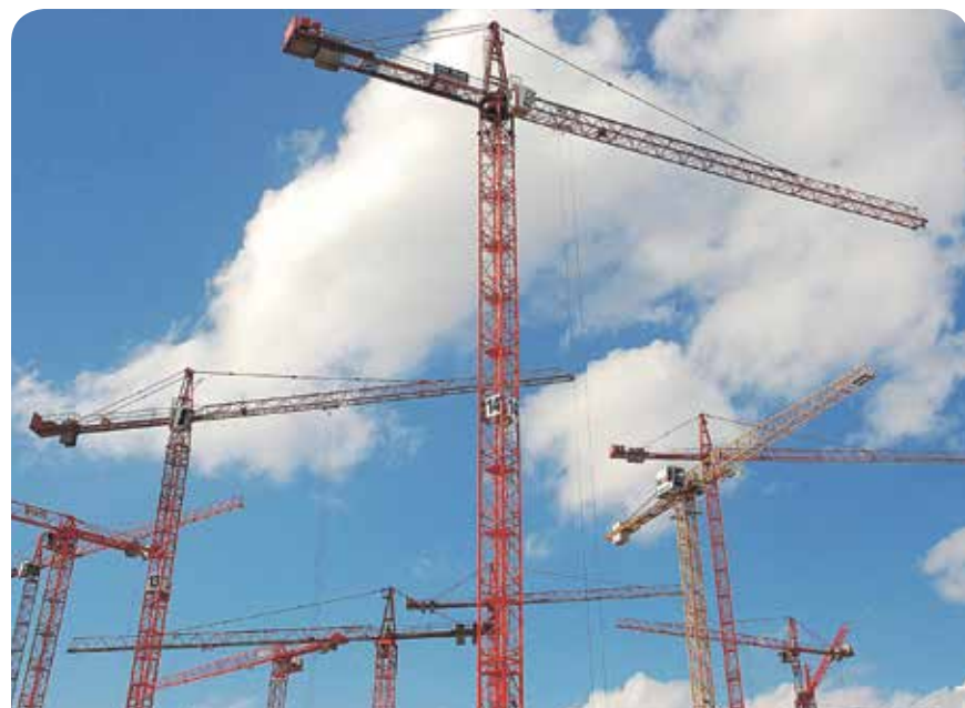
Preiswerte Wohnungen müssen gebaut werden

Ansonsten wird DIE LINKE weiterhin als einzige Partei in Düsseldorf für den Schutz der günstigen SWD-Wohnungen vor Privatisierung eintreten. Für uns steht die Stärkung sozialen und kommunalen Wohnungsbaus an erster Stelle.