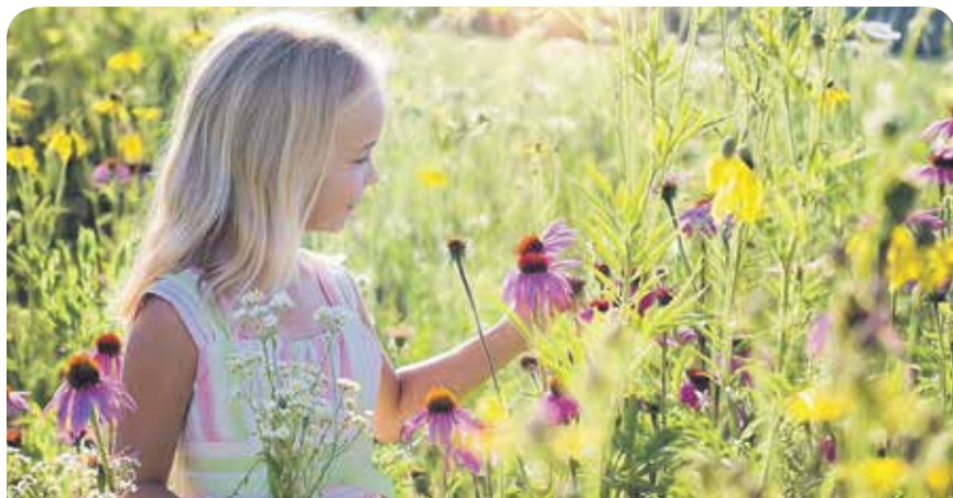
Erst sterben die Tiere, dann die Menschen

DIE LINKE beantragte darum im Düsseldorfer Umweltausschuss den Verzicht auf Glyphosat auf städtischen Flächen. Daraufhin kündigte die Stadtverwaltung an, mit PächterInnen städtischer Nutzflächen über die nachträgliche Aufnahme einer entsprechenden Vertragsklausel zu verhandeln. Bei neuen Pachtverträgen wird generell der Einsatz von Glyphosat ausgeschlossen. Ein weiterer Antrag der LINKEN wurde einstimmig beschlossen: Die Stadt wird schnell umsetzbare Maßnahmen gegen das Insektensterben ergreifen: Bunte Blumenwiesen auf städtischen Flächen anstelle von „englischem Rasen“ oder Steinwüsten machen für Insekten in einer Großstadt den Unterschied zwischen Überleben und Tod aus.