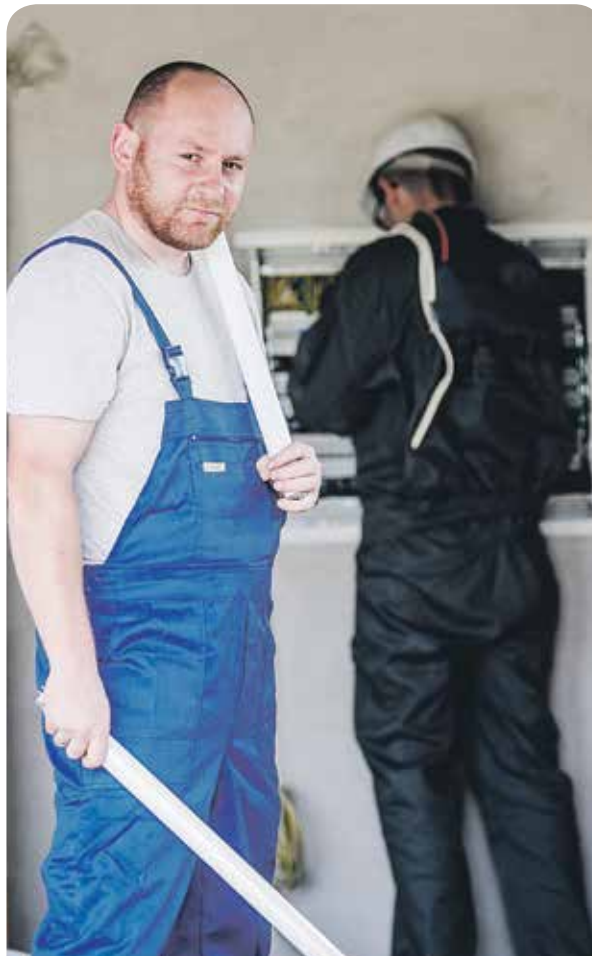
Die freundlichen Herren sind mal wieder da

LINKE fordert auf Bundesebene daher ein Sockel-Tarifmodell mit entgeltfreien Grundkontingenten. Auf diesem Wege würden Sperrungen überflüssig und