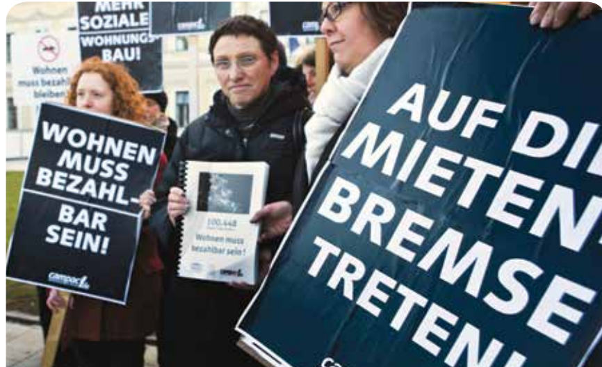
Mieten müssen gesenkt werden

In der Rechtsprechung wird dieser „einfache Mietspiegel“ aber oft nicht anerkannt. Dort ist die Rede vom „qualifizierten Mietspiegel“. Dieser muss nach wissenschaftlichen Kriterien alle zwei