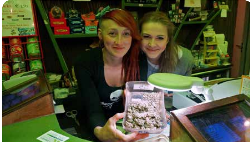
Vielleicht auch bald in Düsseldorf legal zu kaufen

Die Initiative zu einer legalen Cannabisabgabestelle in Düsseldorf ging von der Ratsfraktion DIE LINKE aus. In der Ratssitzung im Juni stellten wir den Antrag zu prüfen, ob eine Abgabe von Cannabisprodukten in Düsseldorf möglich sei. Dies würde die Einrichtung einer lizenzierten Abgabestelle bedeuten, in der Cannabisprodukte auf legale Weise bezogen werden könnten. Der Vorschlag beinhaltet ebenso eine wissenschaftliche Begleitung und den Ausbau des Präventionsangebotes. In der Ratssitzung wurde der Antrag in den Ausschuss für Gesundheit und Soziales sowie den Ausschuss für Ordnung- und Verkehr geschoben. Mit einem Änderungsantrag von den Grünen wurde der Antrag mit Stimmen von DIE LINKE und der Ampel letztendlich beschlossen, was bedeutet, dass die Verwaltung nun eine Ausnahmegenehmigung bei dem Bundesinstitut für Arzneimittel und Medizin beantragen muss. Dieselbe Prozedere läuft gerade für Berlin Kreuzberg, wo das Bezirksamt den Antrag inzwischen eingereicht hat. Hinter den Be-