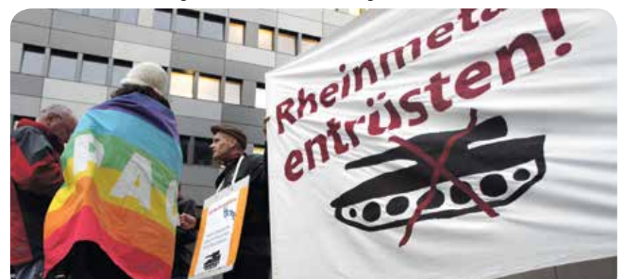
Protest gegen Rheinmetall

Die heutige Rheinmetall AG gehört heute zu den führenden europäischen Rüstungskonzernen. Laut dem Friedensinstitut SIPRI liegt Rheinmetall mit einem Umsatz von 2,240 Milliarden Euro (2014) auf Platz 32 der 100 weltgrößten Rüstungskonzerne. Mit der neuen weltweiten Rüstungsspirale sieht Rheinmetall goldene Zeiten für sich. Weiterhin ist das Geschäft mit Mord für Rheinmetall und seine AktionärInnen äußerst lukrativ. An so ziemlich allen Kriegsfronten auf der Welt finden sich Waffen von Rheinmetall. Das nach diesem Kriegsgewinnler auch noch Straßen und Plätze benannt sind, ist jedoch ein Unding.