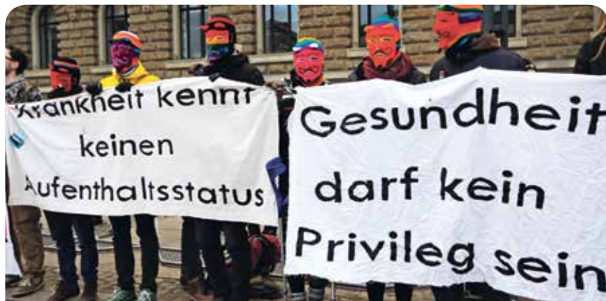
Immerhin eine Verbesserung erreicht

DIE LINKE freut sich, dass es zu einer Verbesserung für die Flüchtlinge in Düsseldorf kommt. Leider wurde durch die Spielchen der Ampel Zeit verschenkt. Dringend notwendig im Bereich der medizinischen Versorgung von Flüchtlingen bleibt zudem weiterhin die Aufhebung der Leistungsbeschränkungen, denn auch mit der neuen Gesundheitskarte dürfen Flüchtlinge sich nur bei akuten