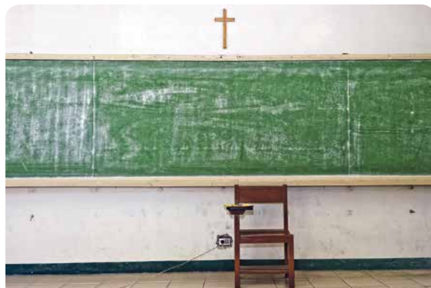
Die Kirche muss aus der Schule raus

Um die Zahl der Bekenntnisschulen zu reduzieren ist es möglich, bestehende Schulen in konfessionslose umzuwandeln. Hierzu muss eine Elternabstimmung initiiert werden, bei der mehr als die Hälfte der Eltern für eine Umwandlung stimmt. Um den Eltern die Möglichkeit zu geben, über die zukünftige Form der Schule ihrer Kinder abzustimmen, beantragte DIE LINKE solche Abstimmungen an allen Bekenntnisschulen durchzuführen. Der Antrag fand im Schulausschuss leider keine Mehrheit.