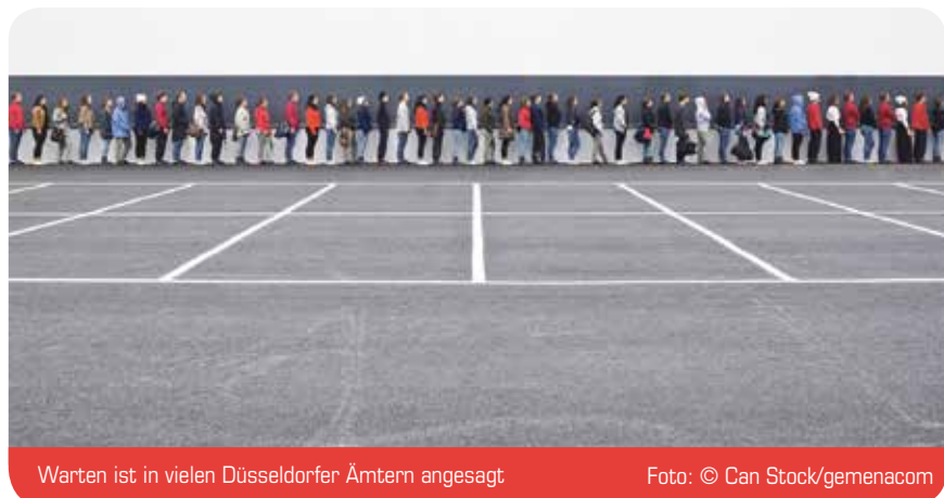
Warten ist in vielen Düsseldorfer Ämtern angesagt