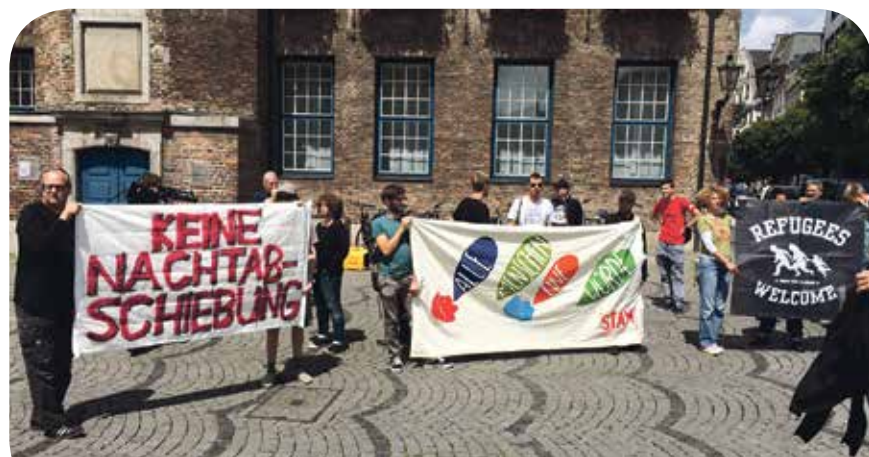
Protest vor der Ratssitzung