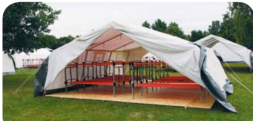
Kein Pfadfinderlager sondern Unterkunft für Flüchtlinge (Hamburg)

kämpfen, können Kommunen Satzungen gegen Wohnraumzweckentfremdung erlassen. ImmobilienbesitzerInnen werden so gezwungen, leerstehende