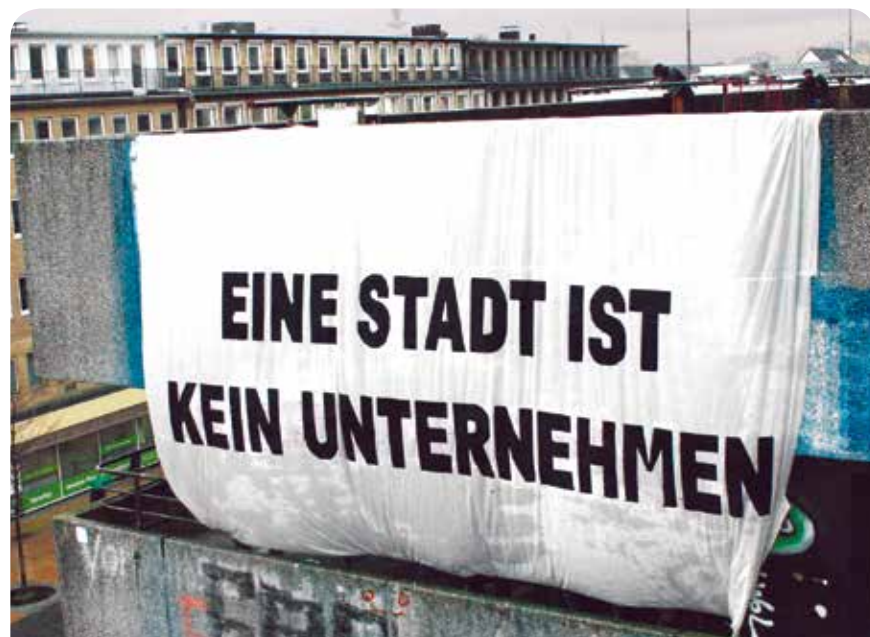
Das sehen Verwaltung und die anderen Parteien anders

Deshalb war und ist DIE LINKE gegen die Ausgliederung von städtischem Eigentum in eine GmbH.